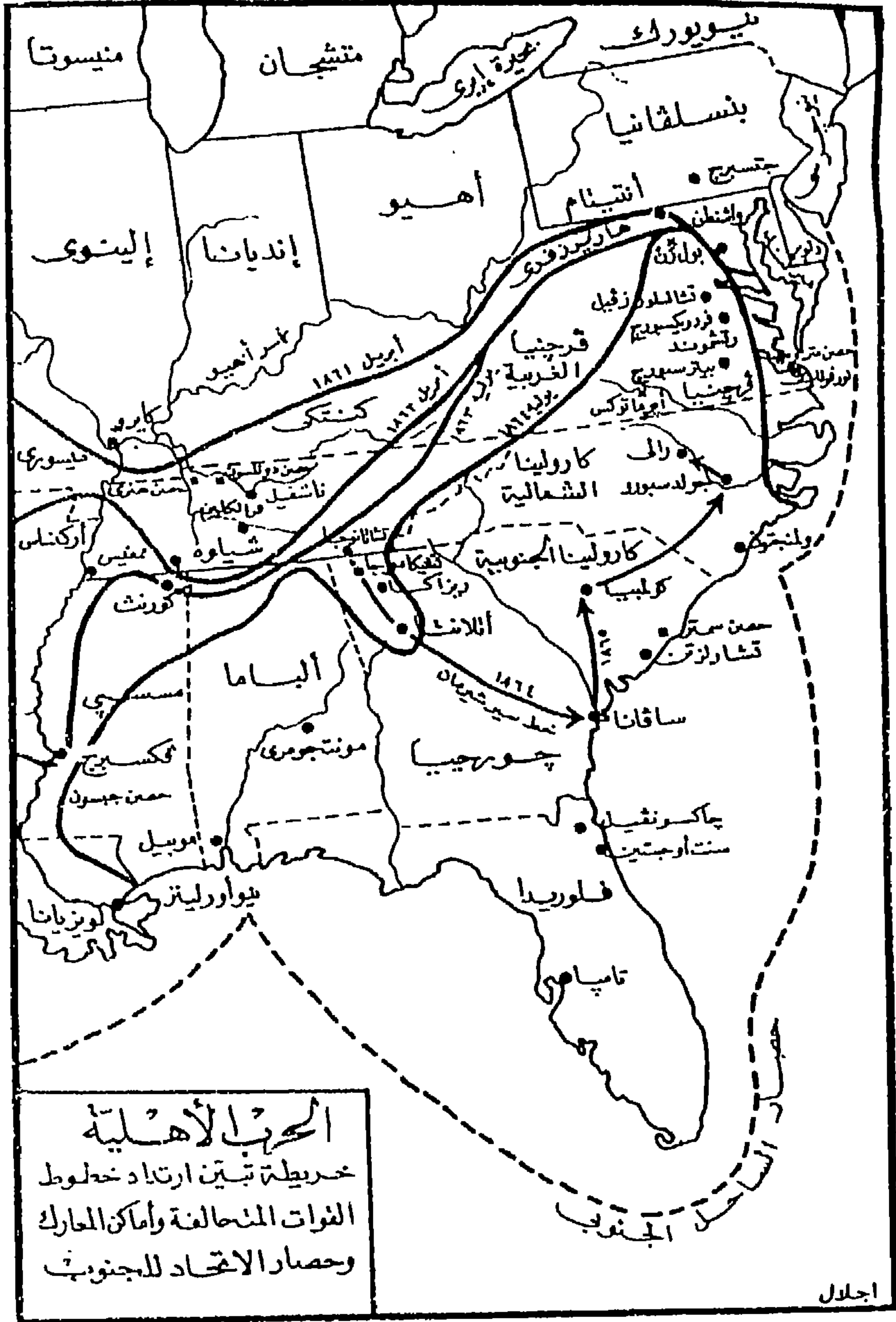
خريطة تبين سير الحرب الأهلية ومواقع المعارك فيها