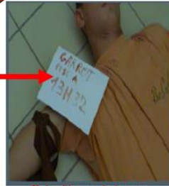
Noter l'heure de la pose