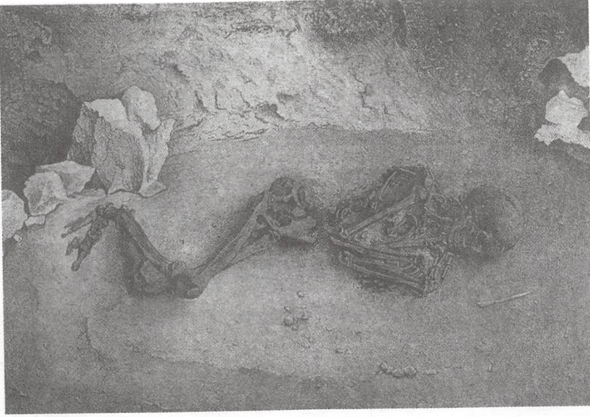
صورة المقبرة الجرافيتية الخاصة "بإنسان مونتون" "L'homme de Menton" التي تم اكتشافها في كهف كافيلون Cavillon بمنطقة جريمالدي Grimaldi بإيطاليا بواسطة إيميل ريفيير Emile Rivière