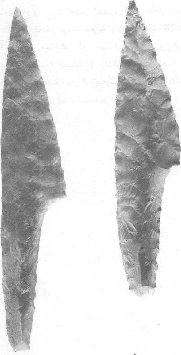
ازمیل منحت سولینبریه ذات فرضة من حجر الصوان تم جلبها من فورنو - نو - دیابل (Dordogn ) فورنوئی Fourneau- du-Diable