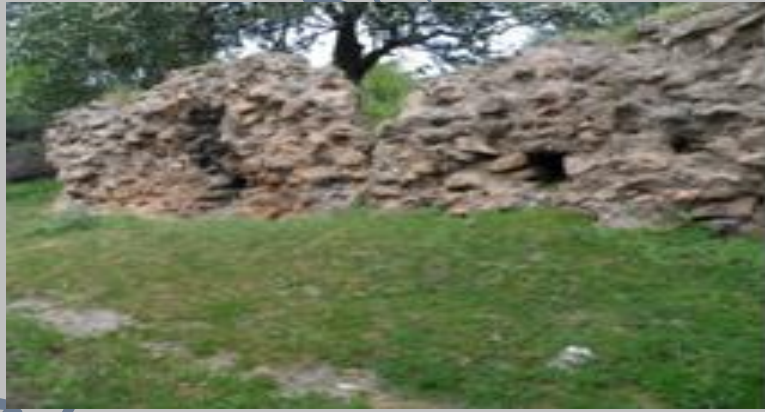
بقايا جدار قلعة إيكجان

مدينة صبرة أو المنصورية: أسسها إسماعيل بن القائم بن عبيد الله المهدي الفاطمي سنة 337 هـ عندما انتصر على صاحب الحمار يزيد بن مخلد بن كيداد.