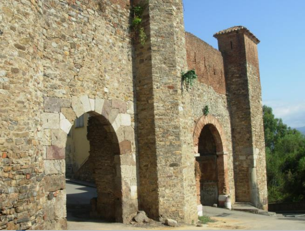
بابا البنود ببجاية

- مدينة القلعة: شرع في بنائها حماد بن بلكين سنة 398 هـ على جبل كيانة ويسمى أيضا بالمعاضيد ، وكان القلعة يدعى في القديم قلعة أبي طويل، وأعلىها الموضع المسى تاقربوست، وهو يطل على سهول الحضنة. - مدينة الناصرية بجاية: بناها الناصر بن علناس في موقع حصين سنة 460 هـ بعد هجر موقع القلعة.