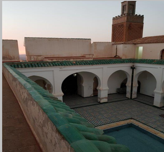
ضريح ومسجد بومدين بتلمسان

سنة 1153م ومسجد ندرومة وضريح بومدين بتلمسان.