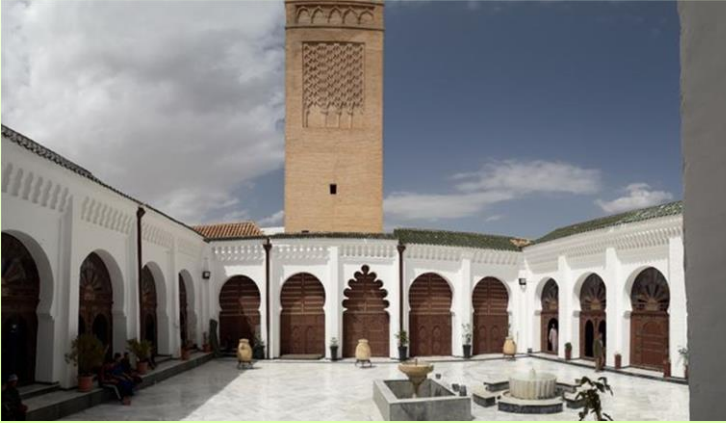
الجامع الكبير بتلمسان