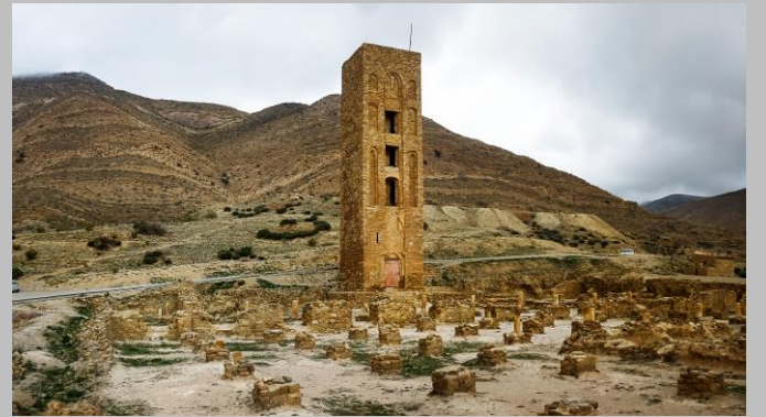
قلعة بني حماد بالمسيلة