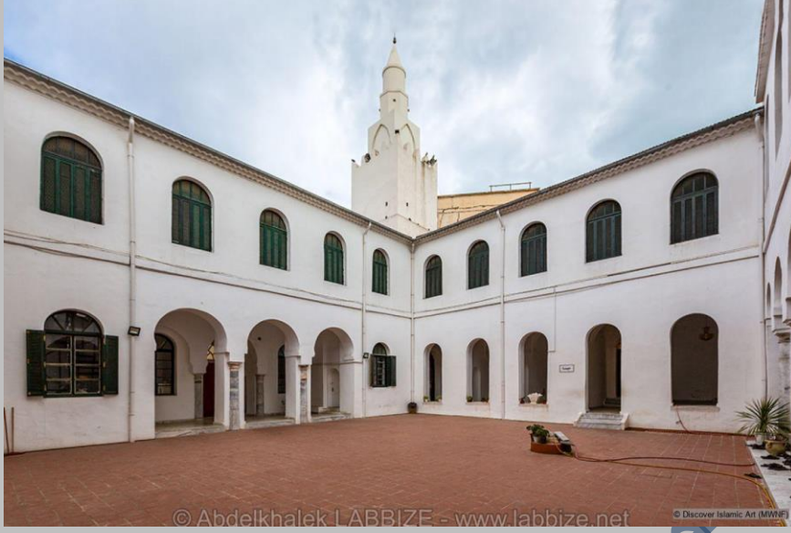
مسجد أبي مروان بعباية