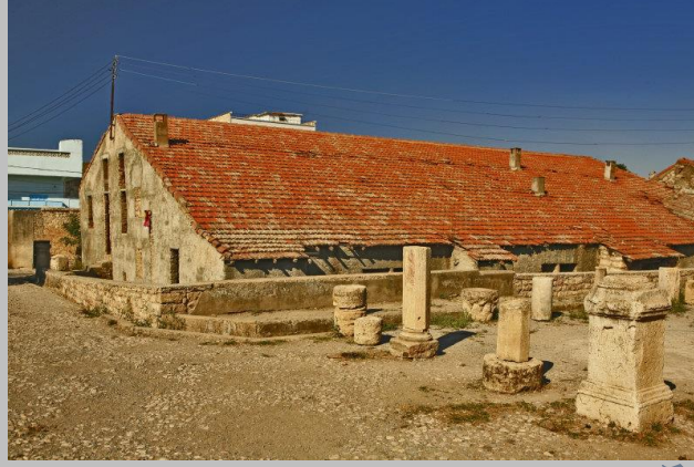
مسجد سيدي غانم *ميلة* أسسه أبو المهاجر دينار

الدوليات الإسلامية في الجزائر: عرفت الجزائر عدة دويلات وإمارات إسلامية أهمها :