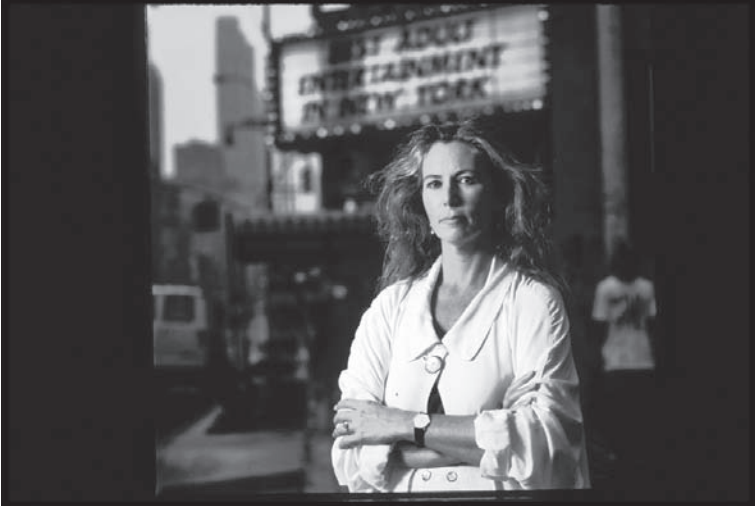
شكل ٤-١: كاثرين ماكينون. 1

أشكال الرقابة سيحدد ما يدخل سوق الأفكار ويسبب الضرر للجميع. يجب أن ينصب اهتمام الحكومة فحسب على ما إذا كان التعبير يسبب ضرراً فعلياً للآخرين أو يحرص عليه.