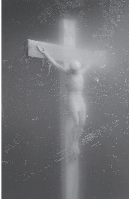
شكل ٤-٢: لوحة «تبؤل المسيح» لأندريس سيرانو. 2

توجد حجة أخرى لمعاملة الفن بوصفه منطقة محمية، وهي أن الفن بطبيعته مجال بشري يقدم اختبارات جادة ومهمة للآراء المسلم بها، فوفقاً لهذا الرأي تكون القيود على الحرية الفنية مضرّة للغاية؛ لأنها تحد من إبداع الأشخاص أنفسهم الذين يحافظون على ثقافتنا حية ومتأملة لذاتها وناقدة لذاتها.