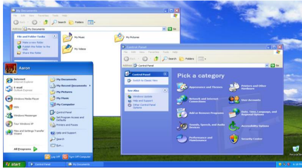
الشكل 2. واجهة نظام التشغيل WINDOWS

النظام ومختلف إصداراته في الوحدة الموالية.