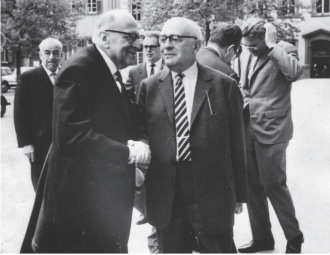
شكل ١-١: ثلاثة من رواد مدرسة فرانكفورت: ماكس هوركهايمر (إلى اليسار)، وتيودور في أدورنو (إلى اليمين)، ويورجن هابرماس (في الخلف). وهذه هي الصورة الوحيدة التي تجمعهم سوياً.