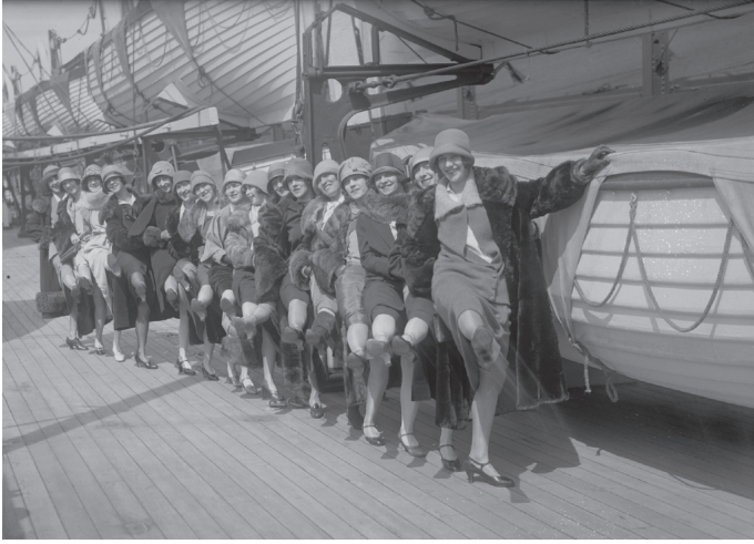
شكل ٢-١: كانت عضوات فرقة تيلر جيرلز يرقصن في أنماط هندسية منسقة بإحكام، بدأ أنها تعكس الإدارة والتنميط المتزايدين للمجتمع الحديث.

القوة المتزايدة للشكل السلعي في مجموعة مقالاته التي ظهرت باسم «الأدب والثقافة الجماهيرية» (ونُشرت عام ١٩٨٤). كما قدم تحقيقاً اجتماعياً رائعاً عن ظهور العقلية البرجوازية من خلال شخصيات أدبية مهمة في مؤلفه «الأدب وصورة الإنسان» (نُشر عام ١٩٨٦).