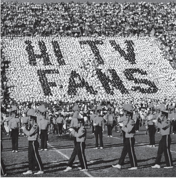
شكل ٦-١: الإذعان وفقدان الفردية يميزان الوعي السعيد.

المجتمع البالغ القوة؛ باستطاعة كل فرد أن يكون سعيدًا، فقط إذا كان سيُذعن تمامًا ويُضحّي بحقه في السعادة.