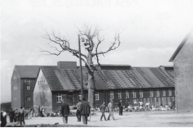
شكل ٤-١: تمتد جذور الفاشية إلى عصر التنوير. وتُظهر الصورة الموضحة شجرة البلوط المحببة لجوته في معسكر اعتقال بوخنفالدينازي.

لم يكن اهتمام هوركهaimer وأدورنو منصباً فقط على الحقيقة التجريبية المتمثلة في أن الشمولية قد نشأت من رَجَم نظام ليبرالي مثل جمهورية فايمر. وكانا مقتنعين بأن الفاشية نتجت عن الأحوال التي كانت قائمة قبل فوزها، ليس كنتاج سلبي، وإنما كاستمرار فعلي لتلك الأحوال التي أنكرتها علانية (ونفاقاً)، وخان الإطار الآتيا الأفكار الليبرالية التي كانت موضوعة فيه؛ فتقويضه للضمير قد صار لأسوأ حال بفعل المُثَل التي كان من المفترض أنها تُبَرِّر وجوده. وكان اليهودي هو الأشدَّ معاناةً، وذلك من الناحية الأنثروبولوجية؛ لأن الحضارة طالما وصفته بـ «الغريب»، ومن الناحية التاريخية لأنه شاع عنه أنه حامل شعلة الليبرالية والرأسمالية.