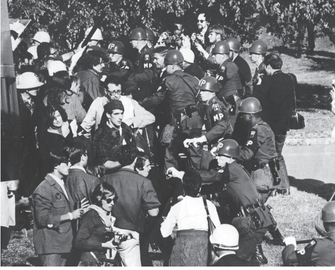
شكل ١: تأثر المفكرون الراديكاليون من بين حركات ستينيات القرن العشرين الطلابية تأثرًا عميقًا بالنظرية النقدية ومدرسة فرانكفورت.

النقدية. غزت مناهج تفكيكية وما بعد بنوية أشهر الدوريات وأهم التخصصات، بدايةً من الأنثروبولوجيا والأفلام وحتى الدين واللغويات والعلوم والسياسة. وقد أنتجت رؤى عميقة جديدة حول العرق والنوع وعالم ما بعد الاستعمارية. لكن، في خضم ذلك، فقدت النظرية النقدية قدرتها على تقديم نقد متكامل للمجتمع، ووضع تصور لسياسات هادفة، وطرح مُثل جديدة للتحرُّر. كما حوّل تفسير النصوص والاهتمامات الثقافية والنزاعات الميتافيزيقية النظرية النقدية تدريجيًا إلى ضحية لنجاحها؛ فكانت النتيجة أزمة هوية دائمة.