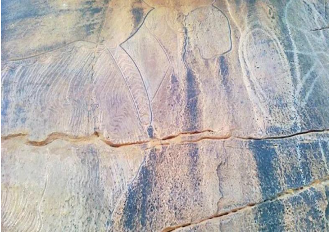
شكل2: محطة كبش بوعلام

تنتشر الرسومات والنقوش في الجزائر في عدة ولايات منها نجد منطقة البيض من أهم المحطات الأثرية التي عثر بها أكثر من الأحد عشر موقع أثري تحاكي رسومات ونقوش بدائية منها موقع كاف المكتوبة، عين صفصافة، عين الخطارة، الروراو، العنبة.