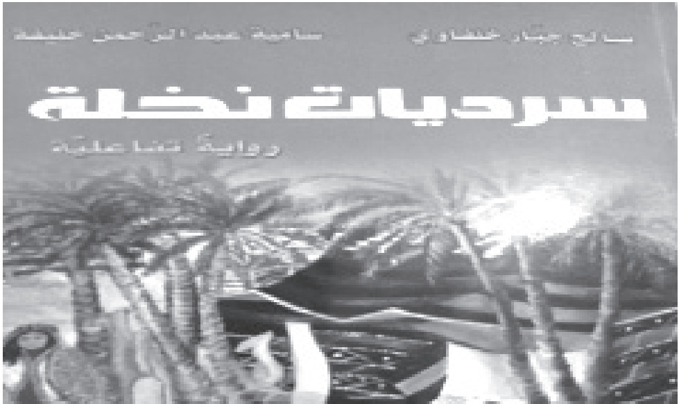
شكل (3) غلاف الرواية التفاعلية الورقية .