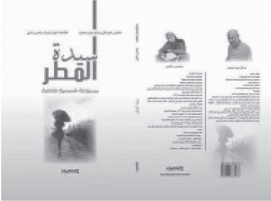
شكل (6) صورة الغلاف لنموذج القصة التفاعلية الورقية، بين الروائي العراقي صالح خلفاوي والشاعرة الجزائرية سندس سامي .