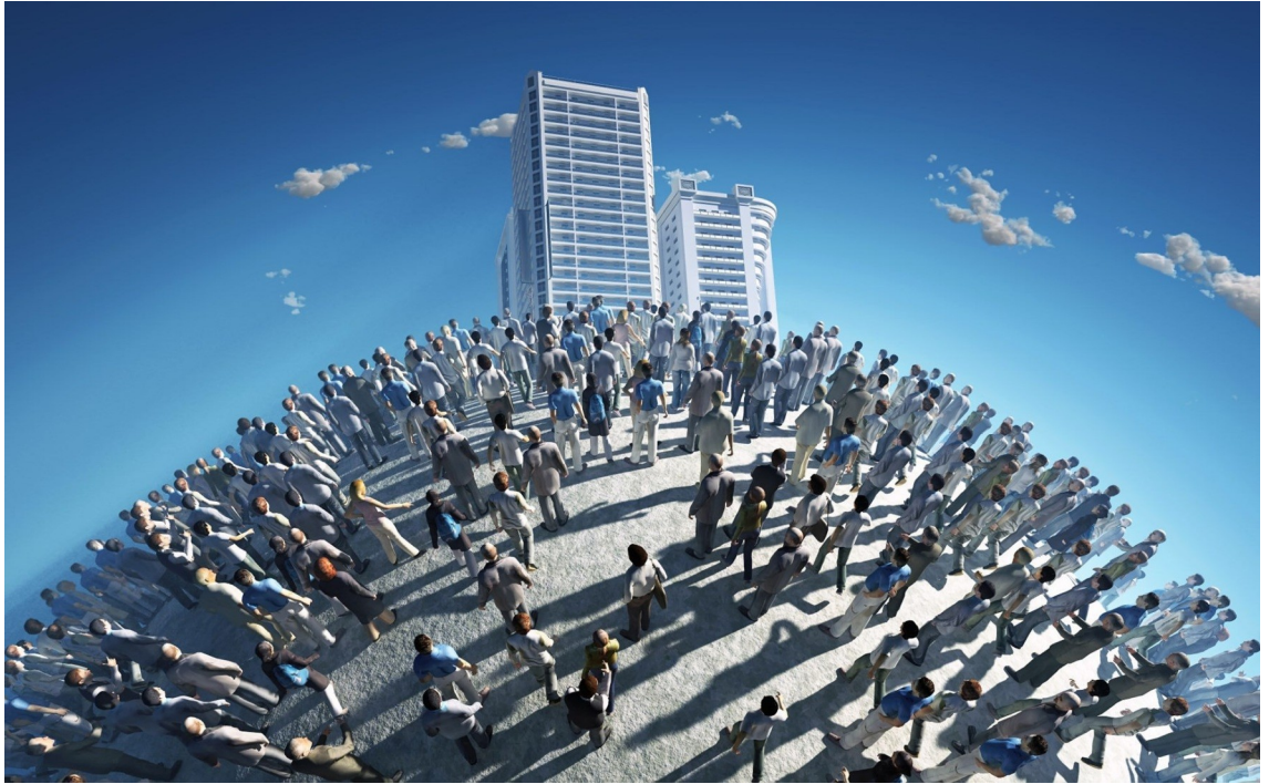
نموذج لحركة اجتماعية