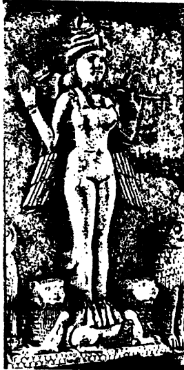
الإلهة عشتار ويبدو التكوير واضحا على مفاتها، حوالي 1900 ق.م

والفترات التي تكون فيها عضلات الرجال بصورة خاصة هي فترات الربيع أي فترات التكاثر قديما، حيث يتصارع فيها الذكور فيما بينهم والقوي صاحب العضلات الأقوى والأكثر تكورا هو الذي يقع عليه اختيار الإناث.