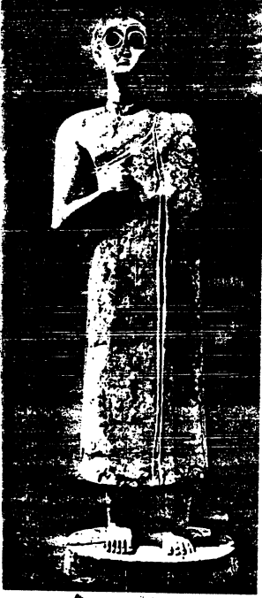
تمثال من منطقة ديالي، حوالي 2500 ق.م يؤكد على كبر العين وصغر الأنف والفم وطول الرقبة