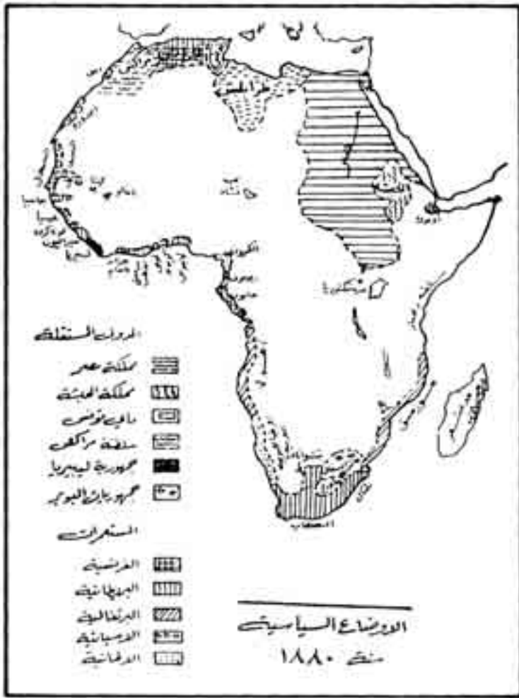
الشكل رقم (١)