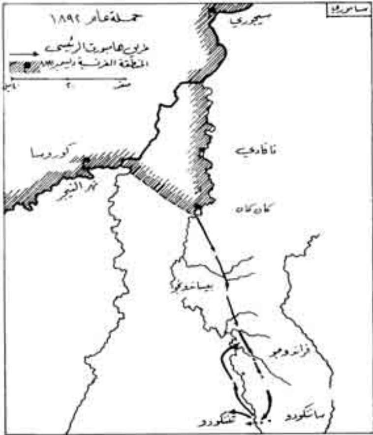
شكل رقم (11)

الذين يكونون له كل عدا، فقرر الابتعاد عن سيطرة الأوروبيين حتى يعيد تشكيل قواته، ويضيف إليها دماء جديدة قادرة على مواجهة هذا الحشد الضخم من الفرنسيين (2).