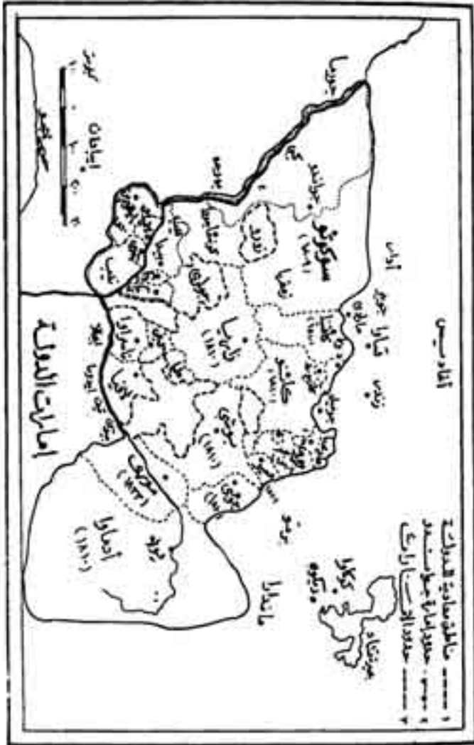
الشكل رقم (3)