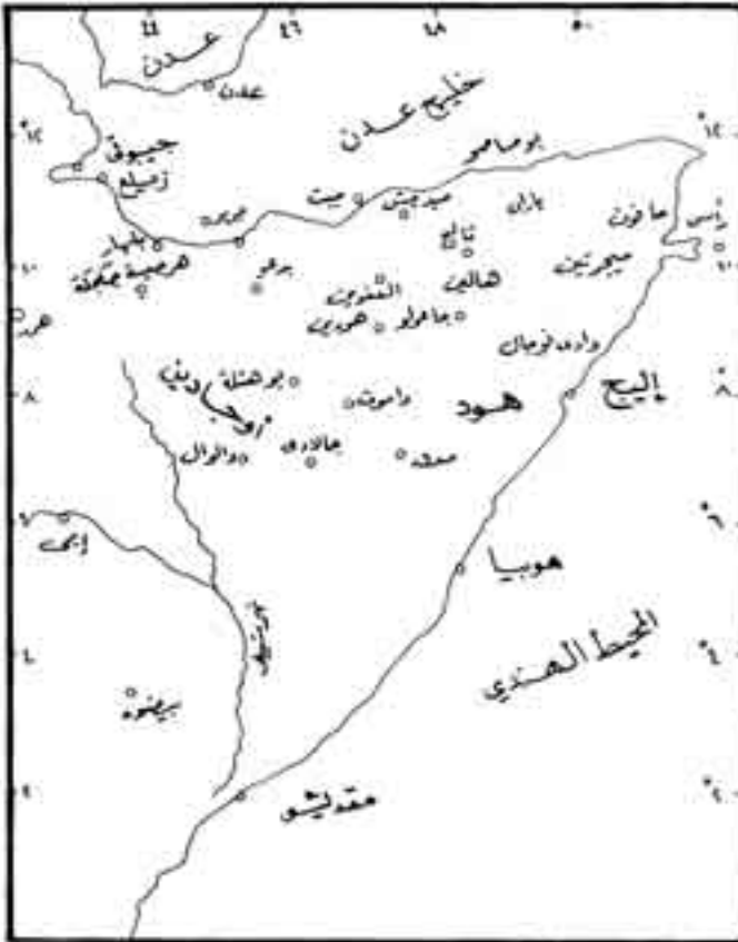
شكل رقم (13)

الصوماليين يقدر بحوالي خمسمائة فارس بقيادة موسى فارح من هود . وأما قوات المجاهدين فقد تمركزت في إقليم بارن وتقدر بحوالي ثلاثة آلاف مقاتل، واتجهت هذه القوة قبل الاشتباكات نحو الجنوب، ووصل سواين إلى بوهوتلي، وأقام بعض الحصون هناك لحماية آبار المياه ومخازن التموين، واستقر أخيرا في أريجو شمال منطقة مدق (2) (Mudug). وفي 20 يولييه عام 1902 بدأت القوات البريطانية هجومها على جيروى (Gherouey) بهدف تطهير ساحل الصومال من الدراويش، ومع نهاية أغسطس وصلت القوات البريطانية إلى جاعولو (3) (Gaolo).