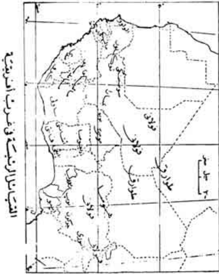
شكل رقم (14)