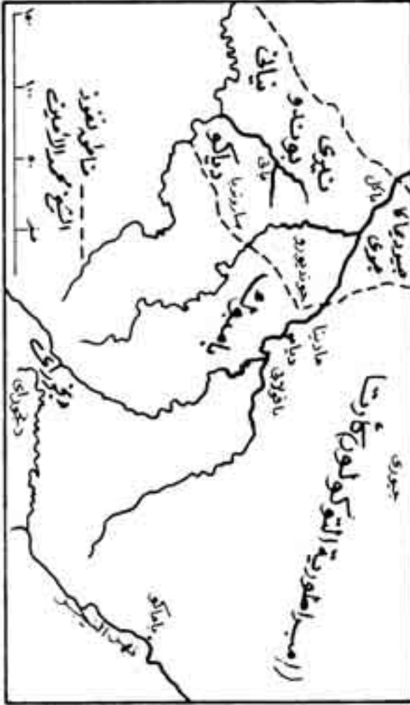
شكل رقم (7)

أحمدو أن يكون حليفا للفرنسيين الذين يسعون للقضاء على إمبراطوريته التي تحدد مصيرها عام 1888 بعد القضاء على كل من الزعيم المسلم ساموري توري، ومحمد الأمين، وصار القضاء على هذه الإمبراطورية الإسلامية أمرا محتما (3) .