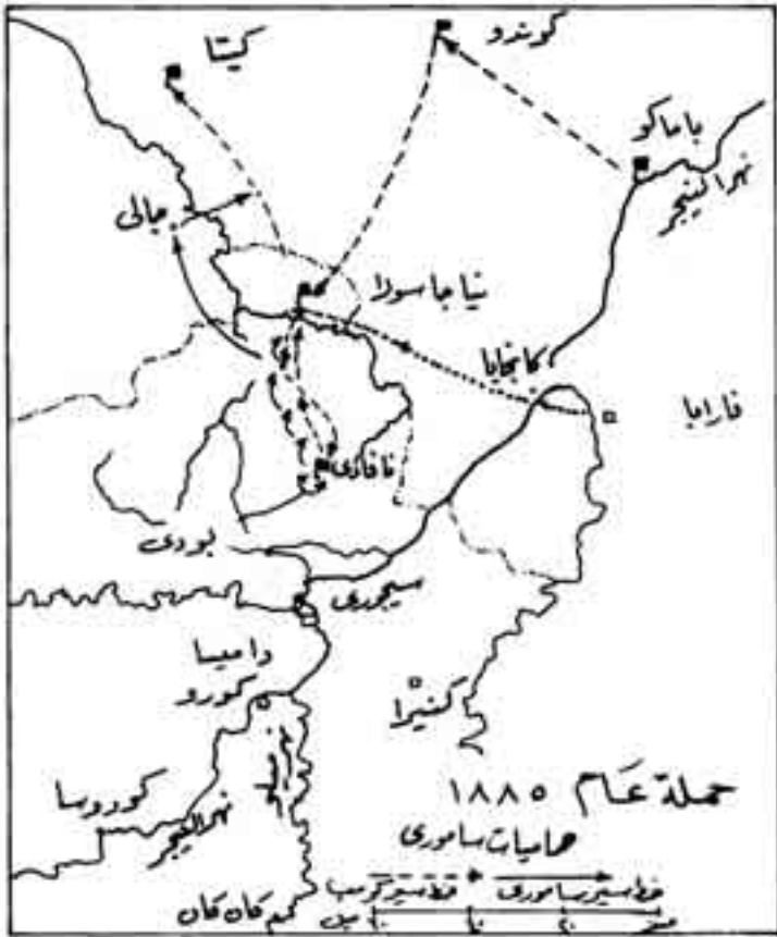
شكل رقم (10)