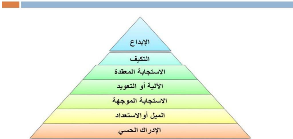
الشكل رقم 03: يمثل تصنيف سيمبسون للمجال الحسحركية