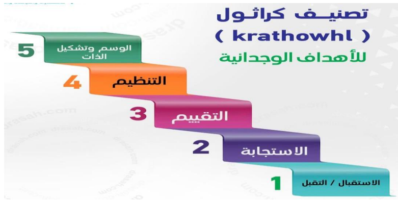
شكل رقم 02: يمثل تصنيف كراثول للأهداف الوجدانية.